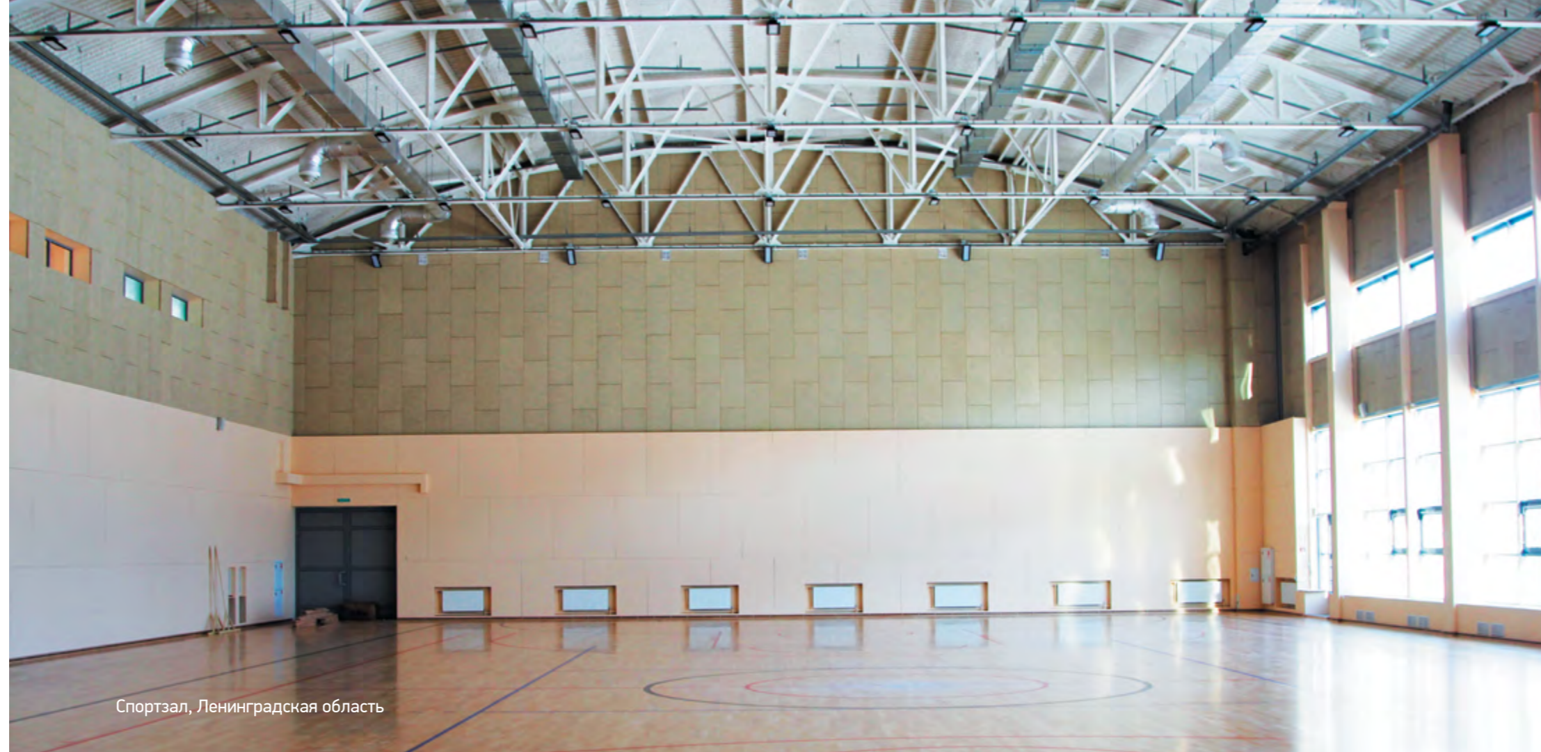
Спортзал, Ленинградская область

панели из древесного волокна на цементном связующем